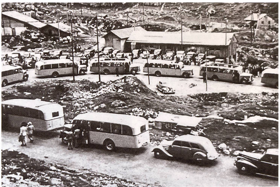
Jedermann will dabei sein an der Eröffnung der neuen Sustenstrasse. Eröffnungsfahrt am 7. September 1946