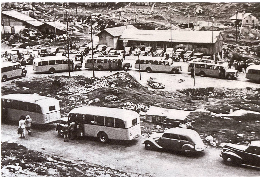
Jedermann will dabei sein an der Eröffnung der neuen Sustenstrasse. Eröffnungsfahrt am 7. September 1946