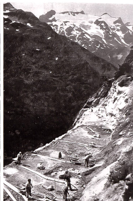
Strassenbau zwischen «Himmel» und Obertal. Giglistock.