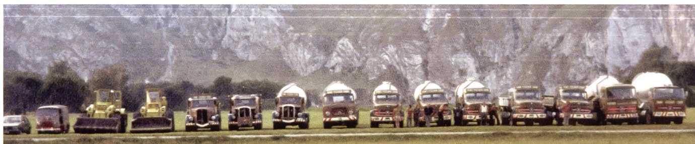
Fototermin der Fischerflotte 1974 auf dem Rossboden in Chur. Neben 4 SAURER stehen 6 Mercedes und 1 Henschel LKW.

SAURER-Kipper werden für Aushub und Schüttguttransporte eingesetzt.