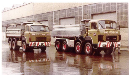
SAURER 3-Achser 330D 1973 und SAURER 4-Achser 330B 1976

SAURER-Kipper werden für Aushub und Schüttguttransporte eingesetzt.