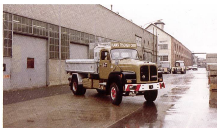
Der letzte SAURER D290B stand während 26 Jahren im Einsatz.

290 PS, WSK 8 Ganggetriebe, v_{max} (nicht plombiert) 128km/h!! Dazu ein superguter Innenretarder (im Getriebe!), der das Fahrzeug auf 20km/h verzögert. Dieser letzte Fischer-SAURER ist noch länger im Einsatz als der V8 1958. Erst 2008 wird er durch einen Mercedes-Benz 5-Achser ersetzt, nach 26 Jahren im Einsatz, davon die letzten 18 Jahre als Pflugwagen auf der A13 zwischen Chur und Reichenau. Auch dieser letzte SAURER wird revidiert und ist Teil der Fischer-Oldtimerflotte.