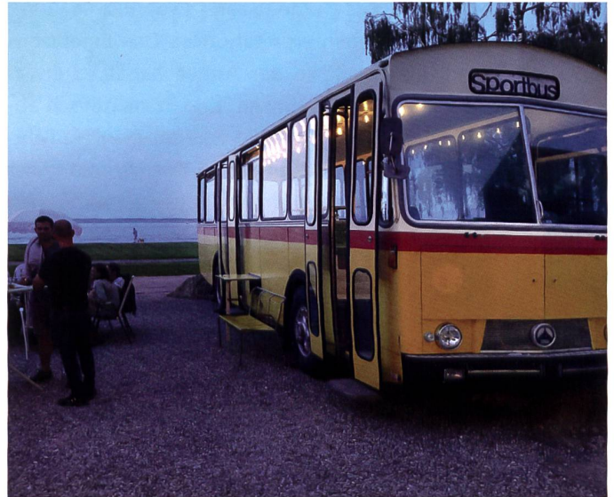
...lädt sowohl tagsüber als auch abends zum Verweilen ein...

Also, wer Eintritt ins Museum will, meldet sich bei der Theke im Container und erhält dort einen Badge für den Eintritt. Wir haben jetzt schon einige hektische Betriebstage hinter uns, und die Erfahrung ist sehr gut. Speziell natürlich und ein erstklassiger Blickfang: Ein zum Café umgebauter 3DUK, also ein richtiges Postauto, mit schön gebauten neuen Cafeteria-Stühlen und einer Stehbar mit maximaler Aussicht auf den Bodensee, ein traumhaftes Angebot. Willkommen an der Arboner Côte d'Azur!!