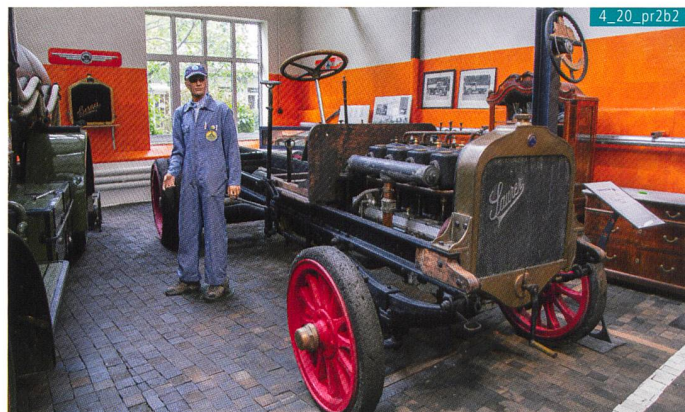
Bild 2. Der LKW 0 von Saurer aus dem Jahr 1903 ist das älteste Fahrzeug im Museum.