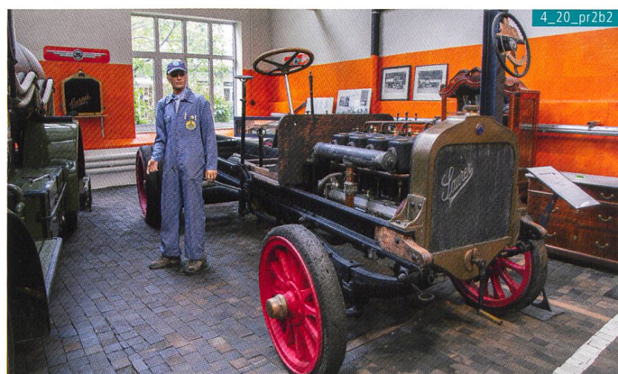
Bild 2. Der LKW 0 von Saurer aus dem Jahr 1903 ist das älteste Fahrzeug im Museum.