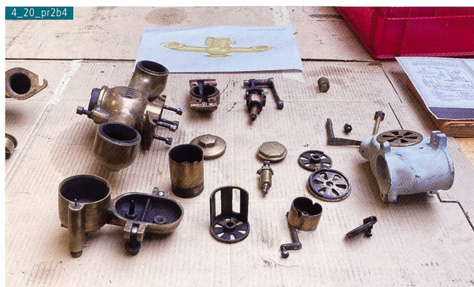
Bild 4. Im Lager Ersatzteile holen ist in diesem Fall nicht möglich. Der Vergaser muss erst wieder aufwendig nachgebaut werden.

Parallel laufen mehrere Restaurationsprojekte. Einerseits liegt ein Vergaser eines A-Modells in Einzelteilen auf einer Werkbank und wartet auf den Zusammenbau (Bild 4). Da einzelne Komponenten neu hergestellt werden müssen, wurden diese vorgängig vermessen und 3D-Skizzen angefertigt. Andererseits steht ein bis auf den Rahmen und den Aufbau zerlegtes ehemaliges Postauto für die Entrostung und die anschliessende Rekonstruktion bereit (Bild 5).