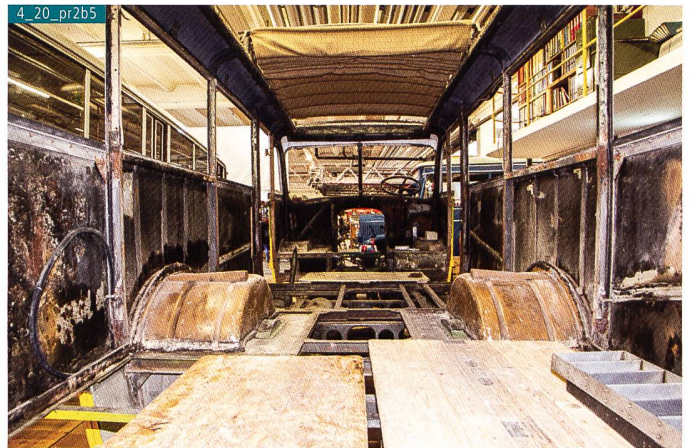
Bild 5. Dieses ehemalige Postauto wird komplett restauriert – für die Realisierung des Grossprojekts sind noch unzählige Arbeitsstunden erforderlich.

Petrol und Benzin wurden anfänglich bei Nutzfahrzeugen als Treibstoff eingesetzt. Selbst Rudolf Diesel half 1908 im Saurer-Werk mit, einen nach ihm benannten Motor herzustellen. Leider dauerte es – bedingt durch den Ersten Weltkrieg – bis 1928, um einen serientauglichen Dieselmotor auf den Markt zu bringen. Anfänglich kam das Acro-Luftspeicherverfahren zum Einsatz, welches von Franz Lang entwickelt wurde und dessen Patente Bosch seit 1925 innehat. Saurer entwickelte das Luftspeicherverfahren weiter und ab 1934 wurde das Saurer-Kreuzstromverfahren zur direk-