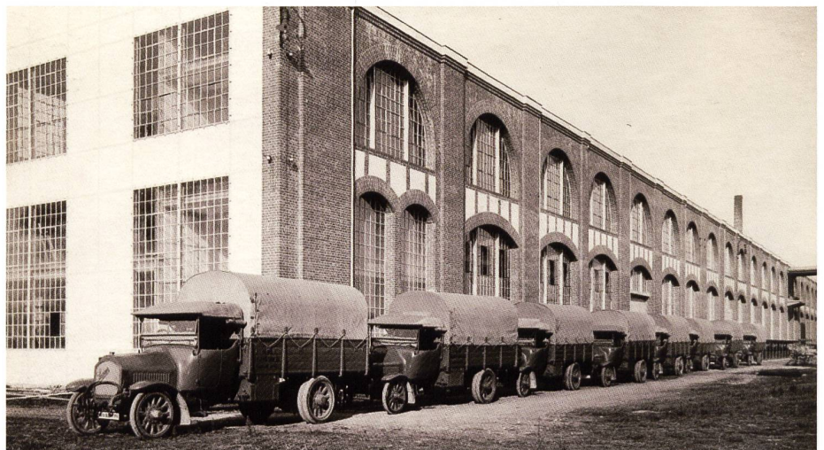
Bald könnte die Webmaschinenhalle wieder in neuem Glanz erstrahlen. Ein Teil des historischen Museums des Kantons kommt möglicherweise in diese Halle. Hier auf dem Bild aus früherer Zeit: eine Serie topaktueller Militärfahrzeuge.