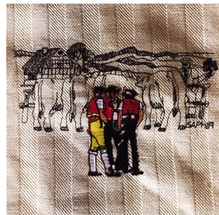
Die Appenzeller Trachtenmänner sind der Verkaufsschlager im Saurer Museum.

Stacher: Ja, stimmt. Das alte Holz ist übrigens so dunkel, weil mehr als ein Menschenleben lang das Öl der Maschinen und der Schweiß der Arbeiter hineingeflossen sind.