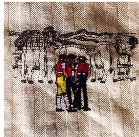
Die Appenzeller Trachtenmänner sind der Verkaufsschlager im Saurer Museum.

Stacher: Ja, stimmt. Das alte Holz ist übrigens so dunkel, weil mehr als ein Menschenleben lang das Öl der Maschinen und der Schweiß der Arbeiter hineingeflossen sind.