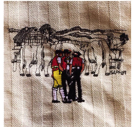
Die Appenzeller Trachtenmänner sind der Verkaufsschlager im Saurer Museum.

Stacher: Ja, stimmt. Das alte Holz ist übrigens so dunkel, weil mehr als ein Menschenleben lang das Öl der Maschinen und der Schweiß der Arbeiter hineingeflossen sind.