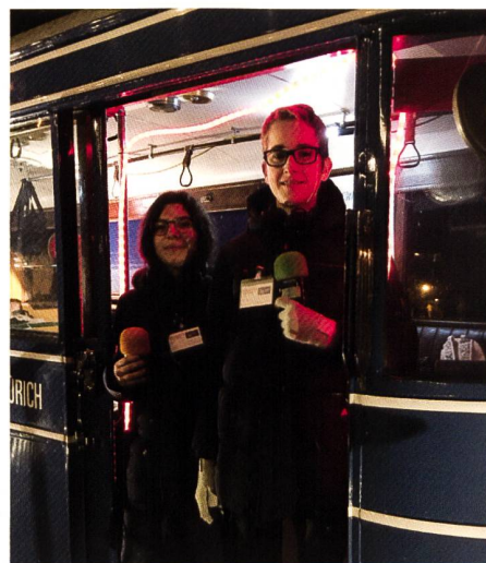
Die beiden kompetenten Radio-Macherinnen

Wenige Stunden später, die Kinder waren wieder abgezogen, schon begannen – ebenfalls gut organisiert – die Ab- und Aufräumarbeiten. Ein tolles Fest ging zu Ende.