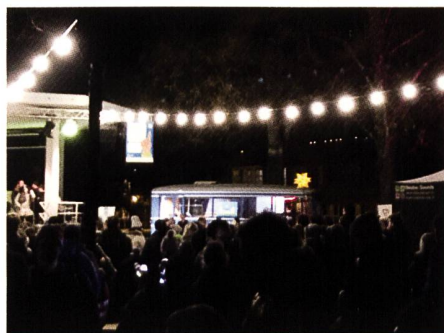
Unser Radiostudio «45» mitten in einer unübersehbaren Menschenmenge