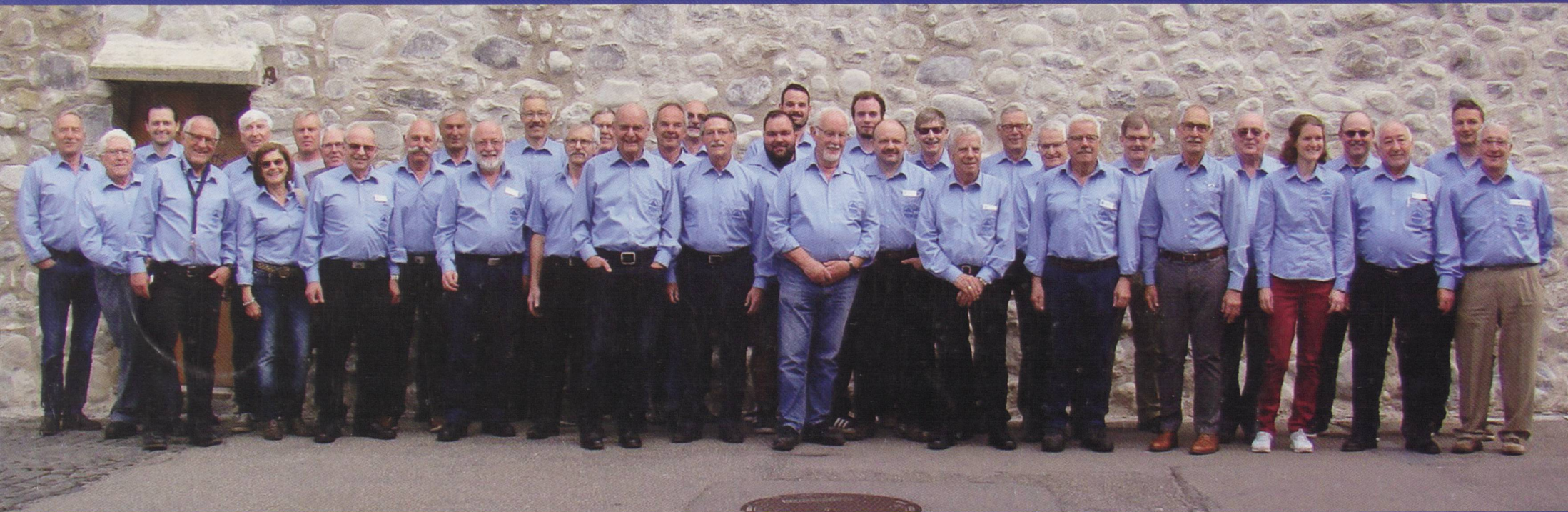
Gruppenbild der Freiwilligen-Truppe (mehr als die Hälfte konnten an der HV 2019 dabei sein)