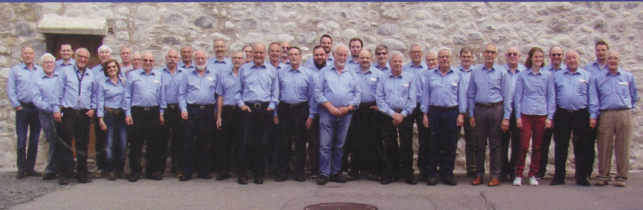
Gruppenbild der Freiwilligen-Truppe (mehr als die Hälfte konnten an der 'HV 2019' dabei sein)