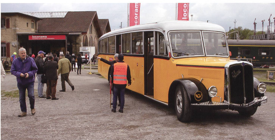
Samstag und Sonntag durften Zuschauer gratis den Rundkurs Fährenbahnhof – Festplatz – Autobau – Locorama in unserem 4C abfahren. Der Service wurde sehr geschätzt, jede Runde voll besetzt!