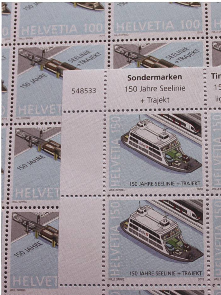
Sogar Briefmarken wurden für diesen Anlass hergestellt, welche man im Post-Eisenbahnwagen erwerben konnte.