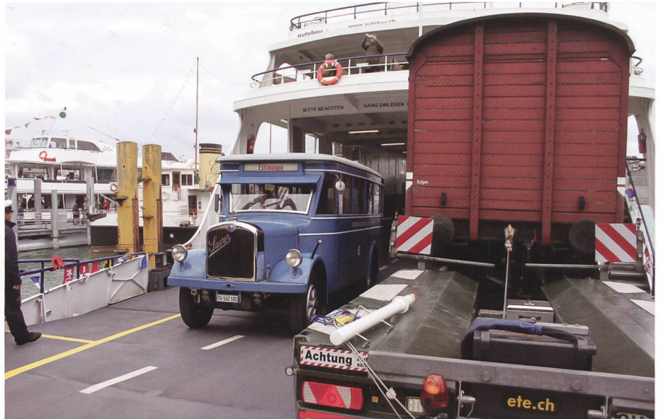
Höhepunkt am Sonntag: unser «45gi», historisch zwar problematisch, aber sehr malerisch und eine Touristenattraktion, durfte auf der Fähre mitfahren von Romanshorn nach Lindau – Bregenz und wieder zurück.