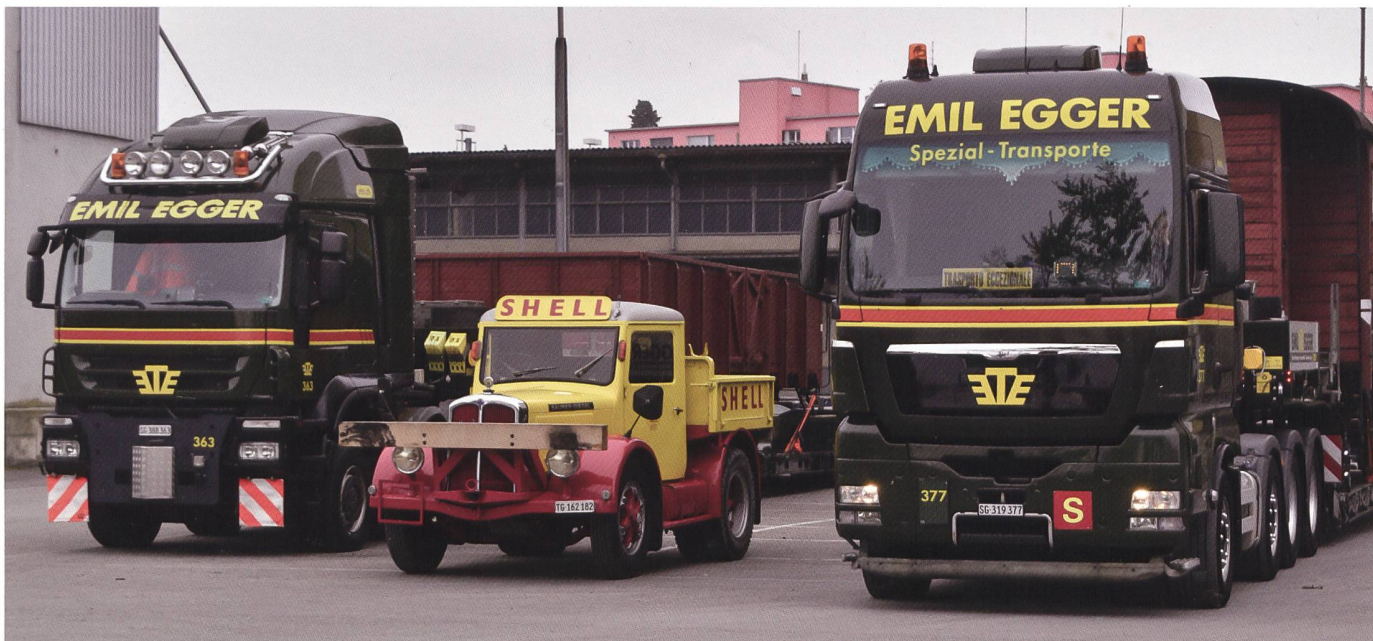
Hier die beiden stolzen Zugfahrzeuge der Tieflader, auf denen schlussendlich die Güterwagen symbolisch auf die Fähre verladen wurden. Dazwischen, schon fast zwergenhaft klein, unser «Shell».

geben. Der Historiker muss jetzt auch noch das zweite Auge zudrücken, unser «45gi» war in Zürich bei der Tram-bahn angestellt, und nicht beim internationalen Fremdenverkehr quer über den Bodensee. Aber eine Augenweide war es halt trotzdem ... Als offizieller Wagenführer durfte ich mitfahren und den vielen Passagieren Auskunft geben über dieses wundersame Fahrzeug. In Lindau erwartete uns eine leibhaftige «Trachtenmusik», die beim Anlegen prächtig aufspielte. Dann ging es weiter nach Bregenz, auch dort legten wir an und Leute konnten ein- resp. aussteigen.