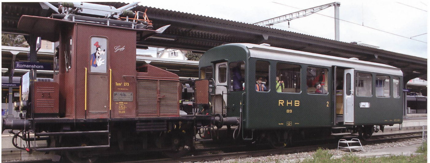
Eine grosse Besucherattraktion: S'Rangierlöveli «Goofy» vom Locorama in Romanshorn.