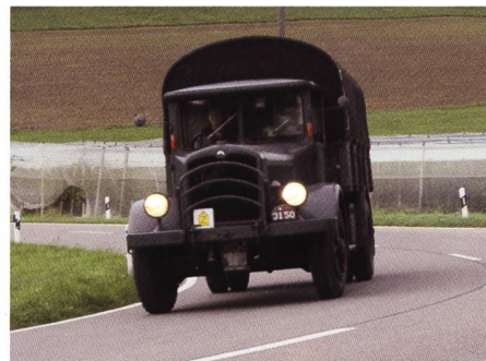
Imposanter Saurer BLD auf dem Weg nach Hallau