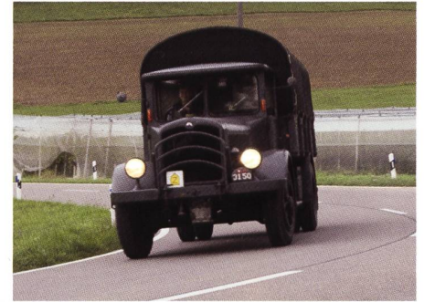
Imposanter Saurer BLD auf dem Weg nach Hallau