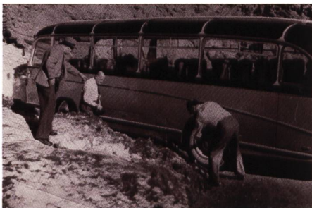
Die Spitzkehr Nr. 40 auf 2'566m verlangte Handarbeit

Als SAURER erfolgreich mit dem Bau des 2H begann, erweckte dieser Wagen auch das Interesse des Automobildienstes der PTT und beschaffte sich 1956 bei Saurer den ersten 2H. Mit dem P 2253 wurden umfangreiche Testfahrten durchgeführt. Um sicher zu sein, dass der 2H auch mit sämtlichen Pässen und Spitzkehren zurechtkommt, wurden am Stifserjoch Versuchsfahrten durchgeführt.