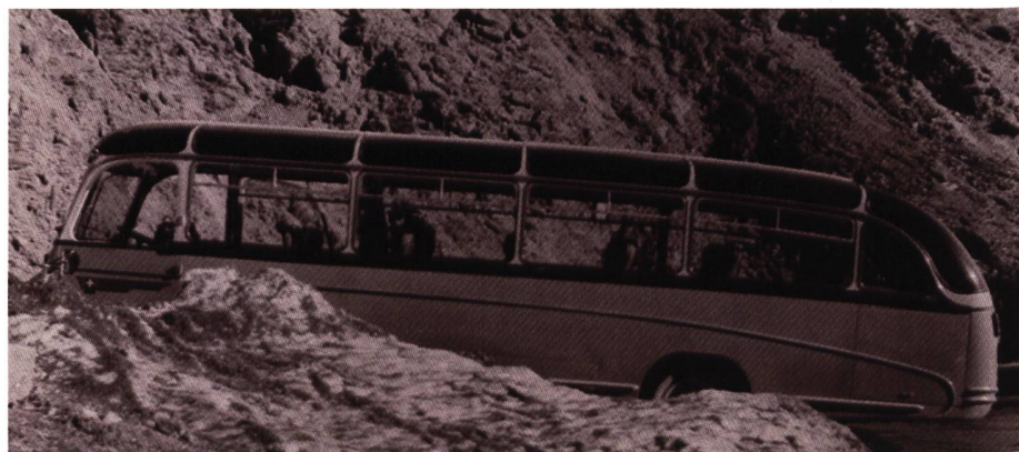
Böse Behauptung: Verstärkung der Motorbremsleistung, wenn man den Chauffeurhut aus dem offenen Fenster hielt