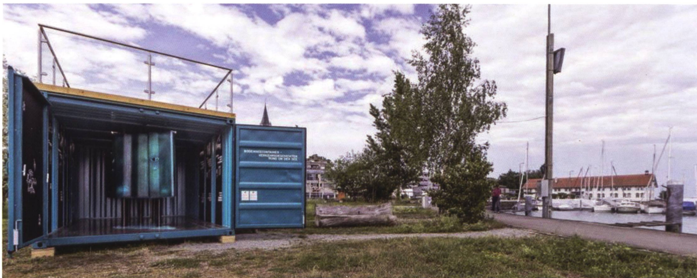
Das «Mini-Museum» im Container.

Der Bodenseecontainer Romanshorn ist offiziell eröffnet. Ab sofort kann der umgebaute Frachtcontainer täglich (08.30 – 19.00 Uhr) und kostenlos von Gästen und Einheimischen besucht werden. Wer auf der Grand Tour of Switzerland unterwegs ist, sollte unbedingt einen Stopp in Romanshorn einplanen, empfehlen die Verantwortlichen. Denn der dreidimensionale Bodensee-Leuchtkörper, welcher sich im Innern des Containers befindet, gibt über verschiedene Gucklöcher Einblicke in die Verkehrsgeschichten von Romanshorn, Bregenz, Lindau, Friedrichshafen und Kreuzlingen / Konstanz. Der begehbare Aufgang auf das Containerdach ermöglicht einen realen Rundumblick auf die verschiedenen Akteure. Auf einer speziellen Kreidewand können die Gäste zudem ihre Spuren hinterlassen. Die Initianten sprechen vom schönsten «Mini-Museum» der Schweiz. Beteiligt am Projekt sind nebst den er-