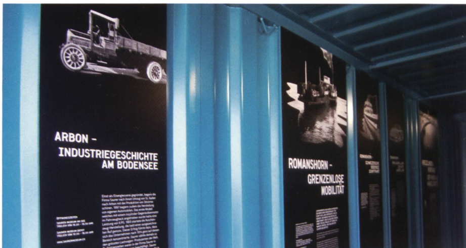
Es ist uns eine Ehre dabei zu sein!