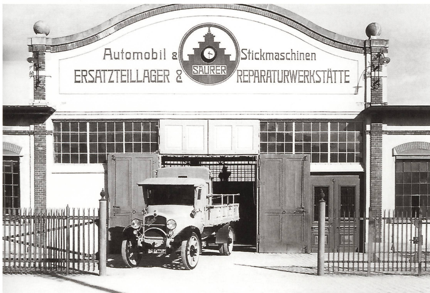
Eingang zum Ersatzteillager in Arbon, 1923