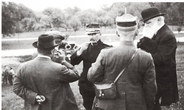
Adolph Saurer (rechts) mit Offizieren anlässlich einer Versuchsfahrt, August 1917