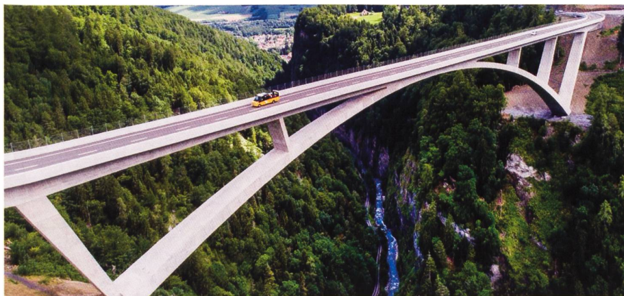
Das Cabrio auf der Taminabrücke