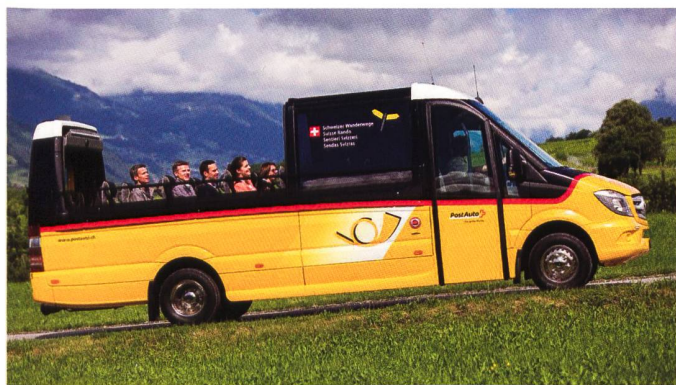
Das neue Postauto-Cabrio wird vor allem für Extrafahrten in Graubünden unterwegs sein.

Beim Wandern lüftet man den Kopf. Das brachte die beiden Partner auf die