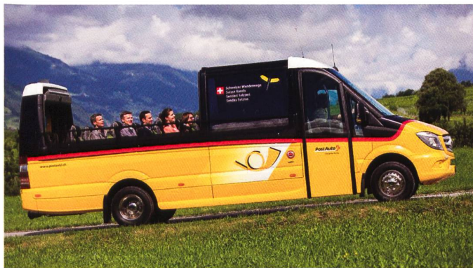
Das neue Postauto-Cabrio wird vor allem für Extrafahrten in Graubünden unterwegs sein.

Mit einem Netz von 77'000 Kilometern erschliessen die Wanderwege und die Postautos die Schweiz: Das Wanderwegnetz umfasst 65'000, das Postautonetz 12'000 Kilometer. PostAuto und die Schweizer Wanderwege gehen nun eine offizielle Partnerschaft ein und sorgen dafür, dass Transport- und Wanderangebote noch bekannter werden.