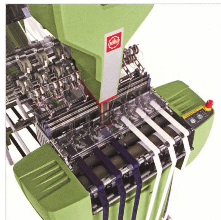
Die neueste Technologie