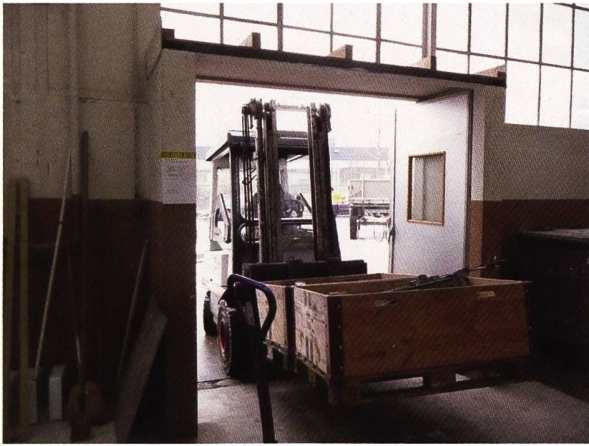
Die Hunderjährige noch in Einzelteilen

fen auch andere Gruppen, wie etwa die Rotarier, bei der Renovation und Instandstellung der Museumshalle mit. Unter der Leitung eines pensionierten Baumeisters wurden die Räume pinselrenoviert, störende Zwischenwände entfernt und eine zweckmässige Beleuchtung installiert.