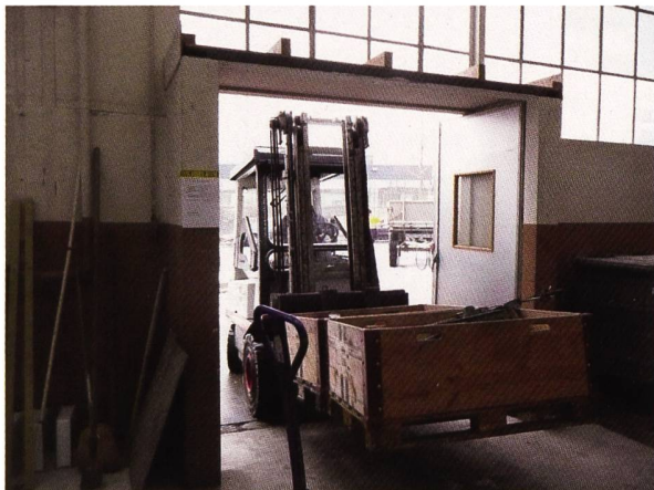
Die Hunderjährige noch in Einzelteilen

fen auch andere Gruppen, wie etwa die Rotarier, bei der Renovation und Instandstellung der Museumshalle mit. Unter der Leitung eines pensionierten Baumeisters wurden die Räume pinselrenoviert, störende Zwischenwände entfernt und eine zweckmässige Beleuchtung installiert.