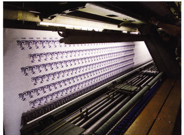
... und sie läuft wieder!!

Im Jahr 1927 machte SAURER die ersten Versuche mit Breitwebmaschinen. Ab Mitte der 30-er Jahre gelang es SAURER mit einem neuen Konzept, die Fachwelt zu begeistern. Die an der Mustermesse