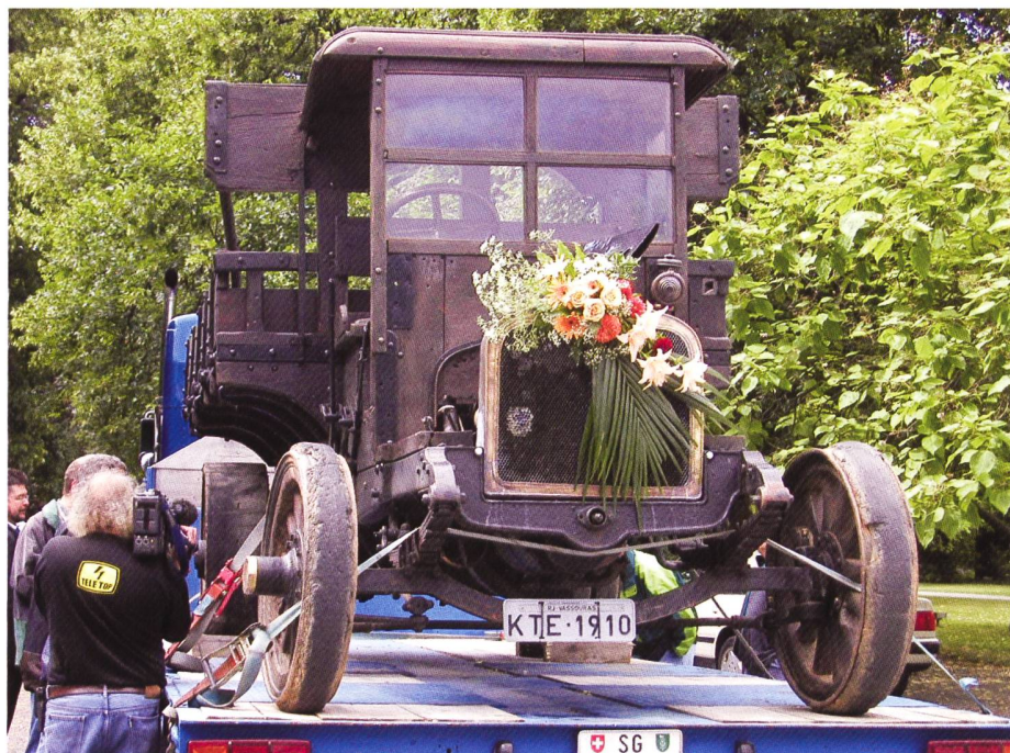
Der Caminhao bei seiner Ankunft in Arbon

Der OCS stellt sich ganz in den Dienst der Industriegeschichte. In unserer GAZETTE, welche viermal jährlich erscheint,