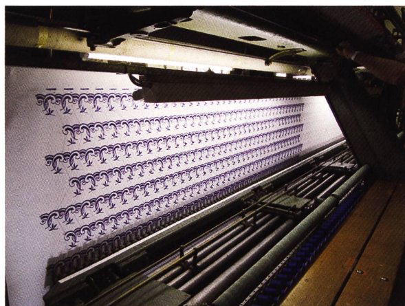
... und sie läuft wieder!!

Im Jahr 1927 machte SAURER die ersten Versuche mit Breitwebmaschinen. Ab Mitte der 30-er Jahre gelang es SAURER mit einem neuen Konzept, die Fachwelt zu begeistern. Die an der Mustermesse