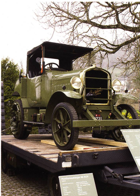
Berna Artillerie Traktor 1932

«Scho e Wili» hät's bruucht! Jedoch pünktlich nach Marschtabelle erreichten die 36 historischen Fahrzeuge Stein am Rhein.