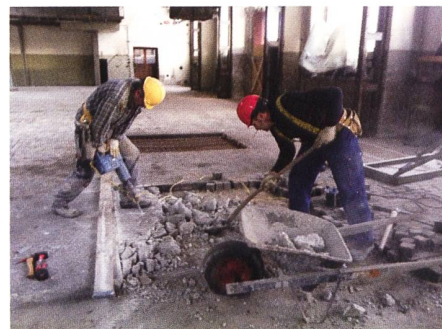
Grossartige Unterstützung durch die Profis, ein toller Service von hrs