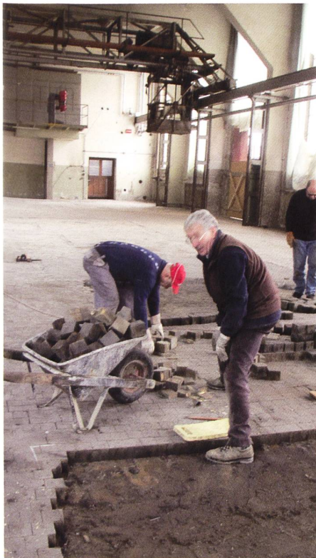
Der Klötzliboden muss repariert werden