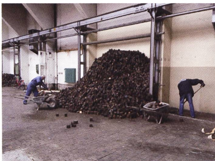
Ein grosser Haufen Reserveklötzli wird umgeschichtet und verschoben