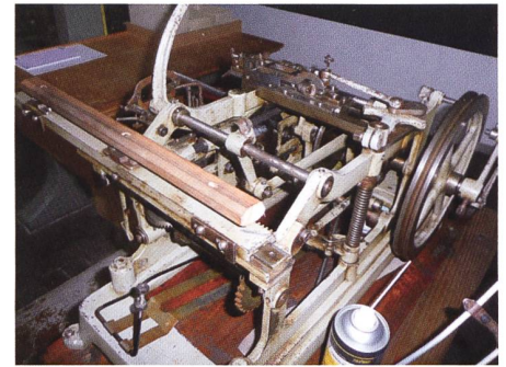
Die im Bericht ebenfalls erwähnte Fädelmaschine, Konstruktion und Patent Saurer