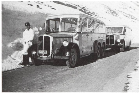
Julier / April 1940