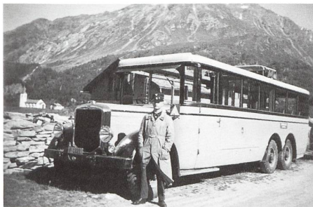
Maloja / Sommer 1935