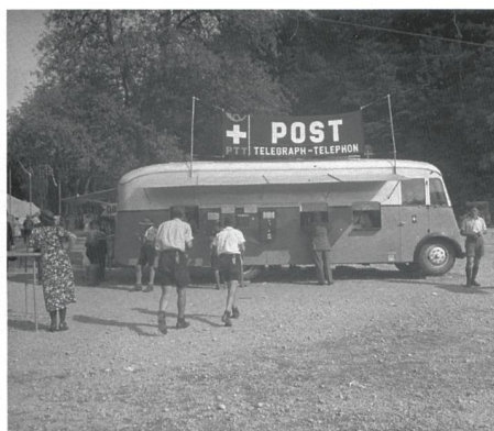
Pfadfinder Bundeslager 1938 / Post-Büro