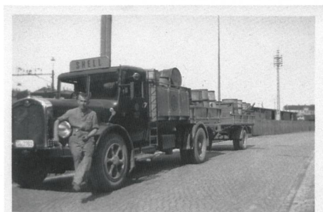
Trägt vermutlich die Betriebsnummer 102. Ort unbekannt, Vermutung A.Heer: Freiverlad St.Gallen