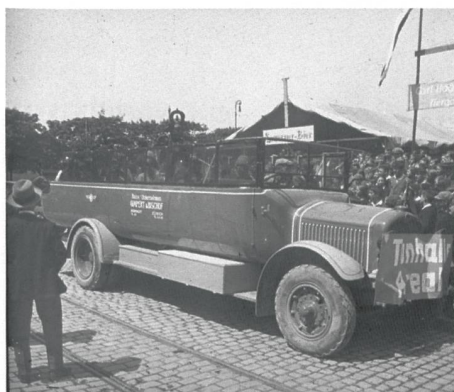
Unbekannter Anlass im Raum Zürich in den 1930er Jahren