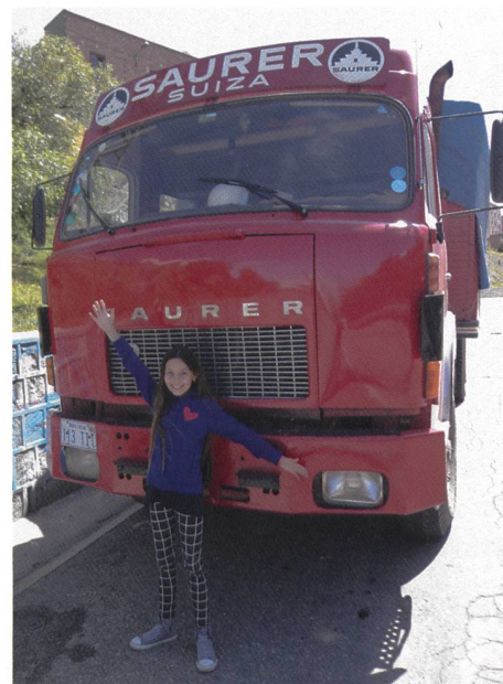
Eine Mexikanerin entdeckt in Bolivien einen Arboner !