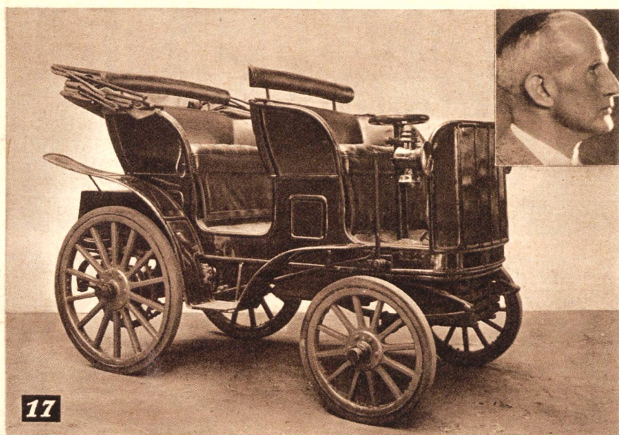
Stoewer-Wagen, Baujahr 1899, Motor 2, 1 Liter Hubvolumen, Zweizylinder, Batteriezündung, 3 Vorwärtsgänge, 2 Bremsen. — Fahrer: Direktor Bernhard Stoewer.

und einige weitere Fotos am Standort des Stoewer-Werkes in Stettin. Bis dahin wurden immer wieder kleinere Änderungen gemacht. Beispielsweise wurde der Röhrenkühler ersetzt. Aber die Spritzwand war bis dahin immer noch dran. Erst einmal, seit das Auto in Moskau ist, wurde es der Öffentlichkeit gezeigt.