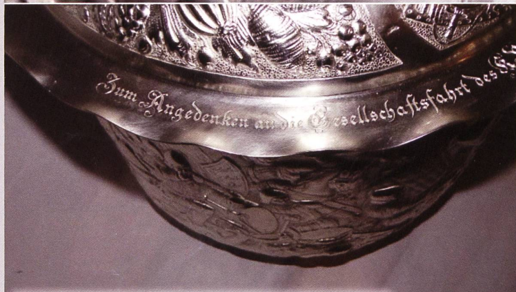
Die Inschrift: „Zum Angedenken an die Gesellschaftsfahrt des...“