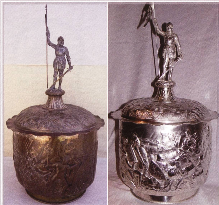
Die punch bowl, so wie sie aus den USA gekommen ist...