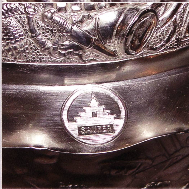
Versehen mit dem damaligen Saurer-Logo „Treppengiebel“