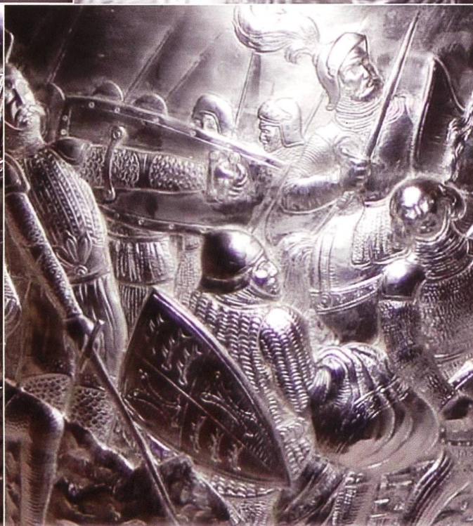
Detail, mit dem Wappen mit den drei Hirschhörnern