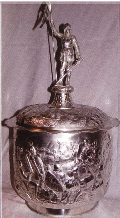
... und nun perfekt restauriert!