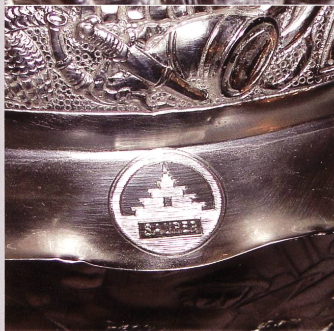
Versehen mit dem damaligen Saurer-Logo „Treppengiebel“