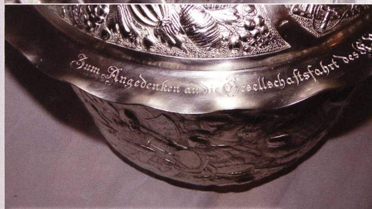
Die Inschrift: „Zum Angedenken an die Gesellschaftsfahrt des...“