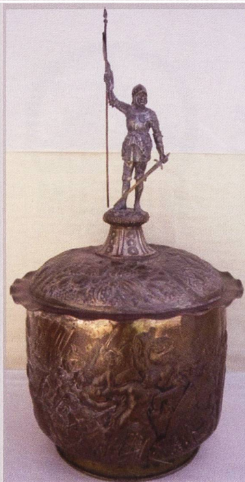
Die punch bowl, so wie sie aus den USA gekommen ist...