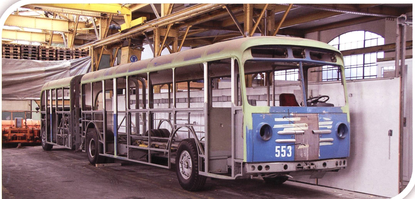
„Dr Glänki“ kommt nach Arbon zurück