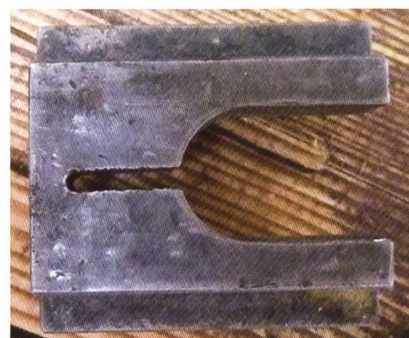
Spannbacke zu Düsenmontage