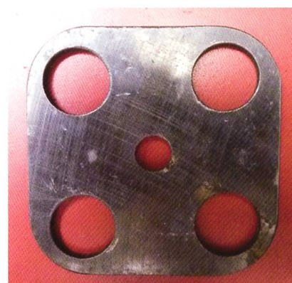
Vorrichtung zu Ventilausbau