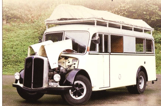
Frisch restauriert, Bühne auf dem Dach, Sound-Ausrüstung (optional)