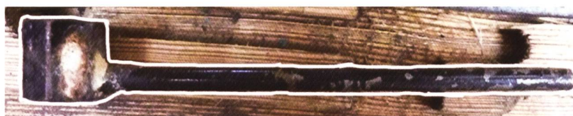
12er Steckschlüssel mit Griff