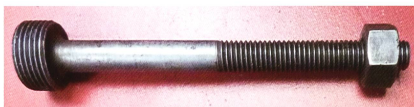
Gewindebolzen zu Ventilausbau