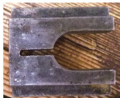
Spannbacke zu Düsenmontage