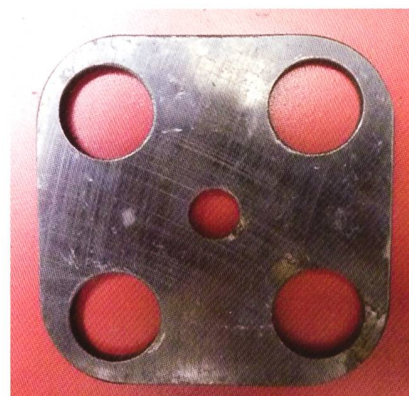
Vorrichtung zu Ventilausbau