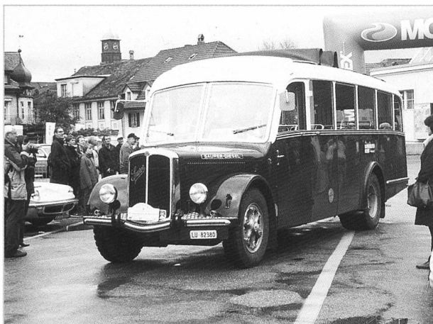
Vom Publikum in Langenthal bewundert: Saurer N2C Alpenwagen II, 1954

Zum Ausklang der Oldtimersaison führt Swiss Oldtimers, der über 100 Clubs umfassende Schweizerische Dachverband für Historische Motorfahrzeuge, jeweils das Rassemblement National durch. Hierzu wird jedesmal eine andere attraktive Kleinstadt ausgewählt. Das 27. Rassemblement fand am 7. Oktober 2012 in Langenthal statt, und dem Regenwetter zum Trotz hatten sich 127 Oldtimerautos eingefunden.