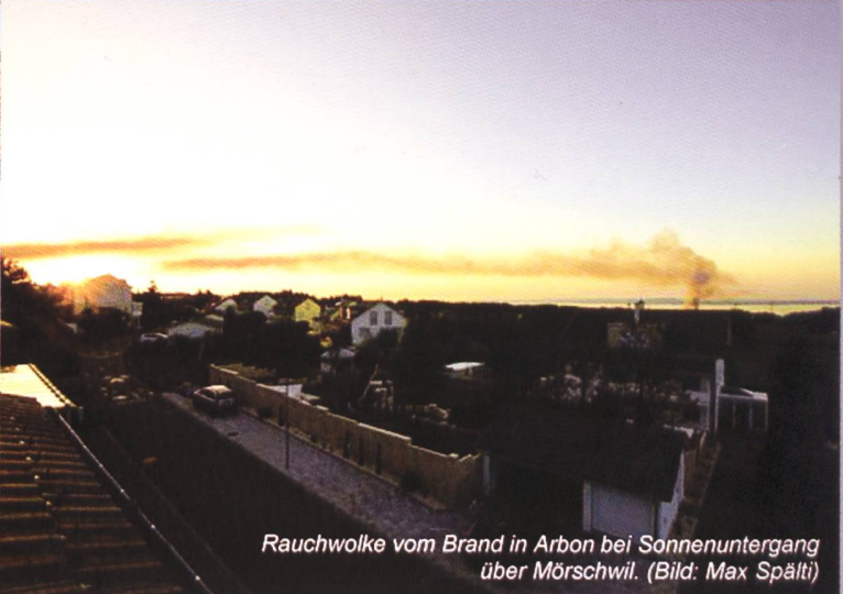
Rauchwolke vom Brand in Arbon bei Sonnenuntergang über Mörschwil.