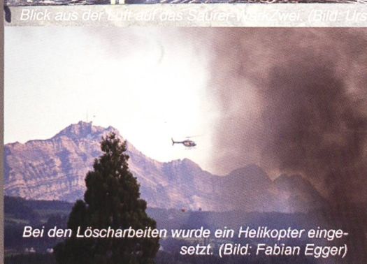
Bei den Löscharbeiten wurde ein Helikopter eingesetzt.