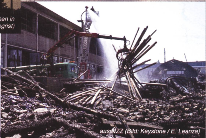
aus NZZ (Bild: Keystone / E. Leanza)