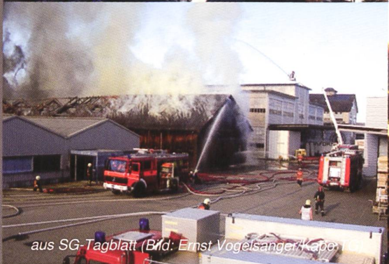
aus SG-Tagblatt (Bild: Ernst Vogelsanger, Kapp)