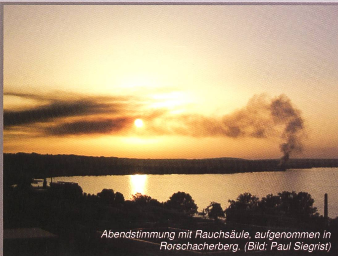
Abendstimmung mit Rauchsäule, aufgenommen in Rorschacherberg.