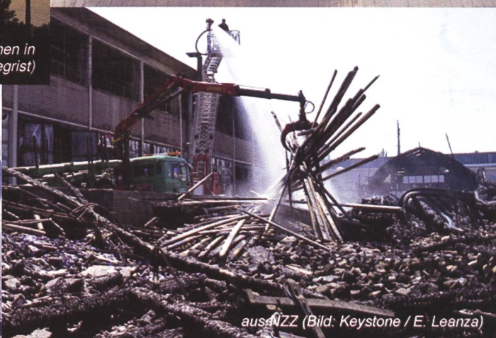
aus NZZ (Bild: Keystone / E. Leanza)