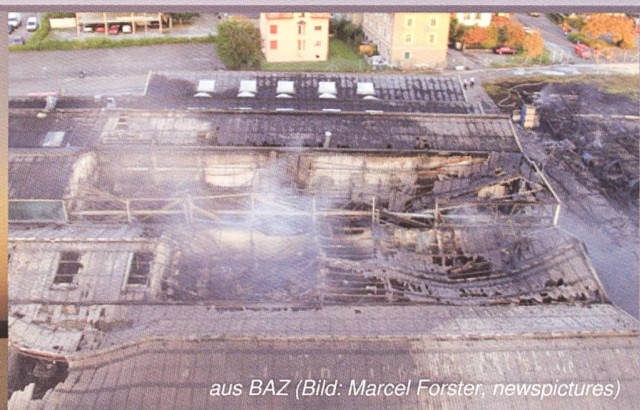
aus BAZ (Bild: Marcel Forster, newspictures)