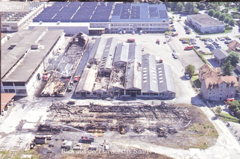
Blick aus der Luft auf das Saurer WerkZwei.