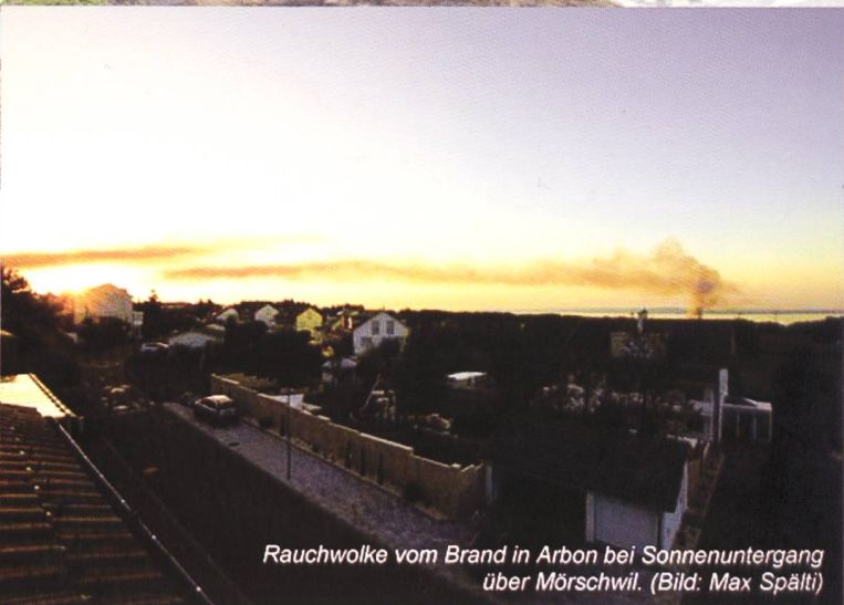
Rauchwolke vom Brand in Arbon bei Sonnenuntergang über Mörschwil.