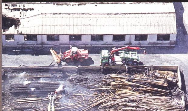
Blick aus der Luft auf das Saurer-Werk Zwei.