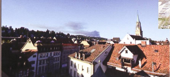
Rauchsäule des Saurer-Grossbrandes, gesehen von St.Gallen aus.