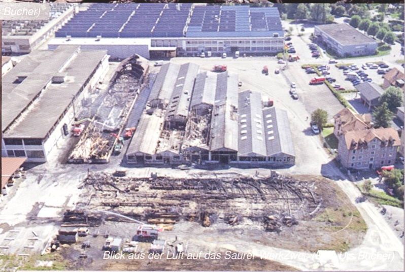
Blick aus der Luft auf das Saurer Werk Zwei.