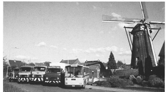
Fotoshooting bei der Mühle in Maasbracht