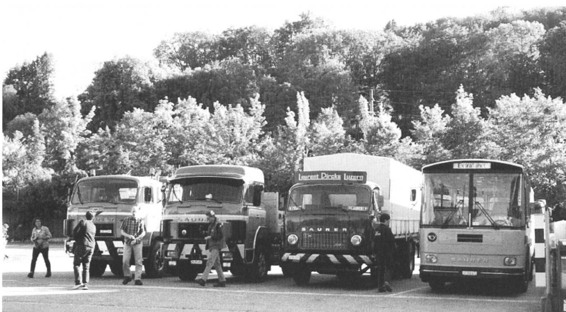
Letzter Halt in Bözen

Der Sonntag brachte noch einige weitere Teilnehmer und viel Wind mit sich. Umso wichtiger war die stete Versorgung mit heissem Tee und Kaffee, der im 4DF Wohnmobil immer wieder frisch zubereitet werden konnte. Auch die Versorgung mit Kuchen und der Gesprächsstoff rissen nicht ab. Um 16.00 Uhr verteilte die Organisation die schon fast legendären gusseisernen Erinnerungen und schon bald lichteten sich die Reihen wieder. Die Schweizer Delegation reiste erst am Montag wieder in die Schweiz, so dass die Gelegenheiten für gute Fotos bei der Abfahrt nochmals voll ausgenutzt werden konnte.