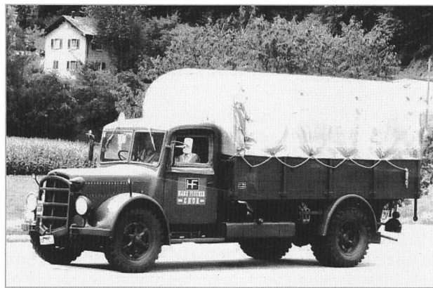
Bild aus der Schweizer Illustrierten von 1943 - nein, Bild von heute