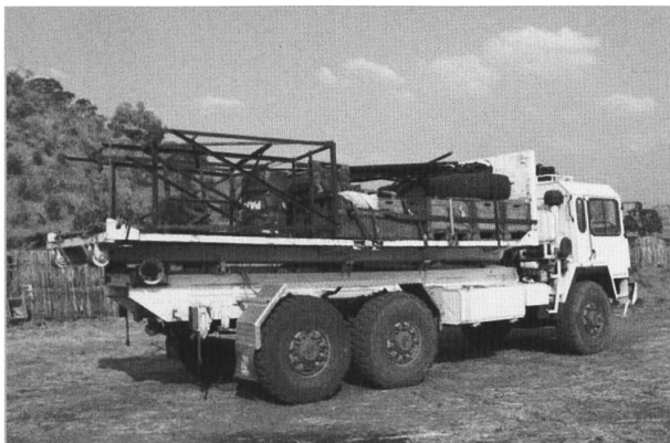
Rücktransport 2. Fahrt

Am nächsten Tag begannen Paulino und ich, unseren 20“-Container auszuräumen. Wir beluden die Abrollbrücke des Saurers von Hand und brauchten dafür einen Tag. Zu unserem Material kamen noch Gestelle für die Wassertanks des Camps, die ebenfalls nach Damazin zurück gebracht werden mussten.