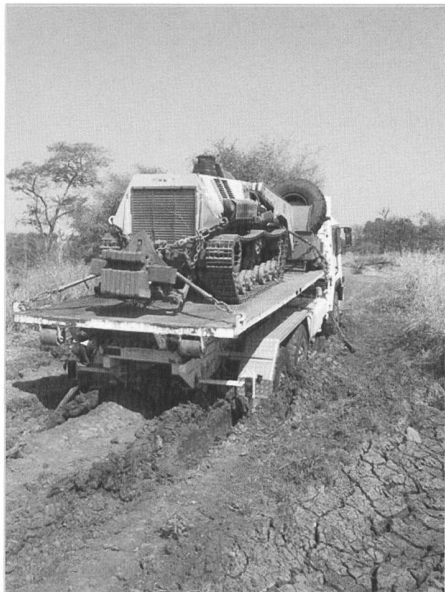
Mit Saurer steckengeblieben