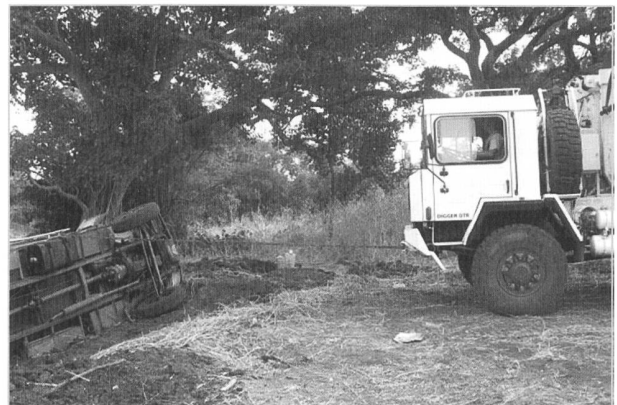
Aufstellen des umgekippten LKWs

Nach einer Weile abenteuerlicher Fahrt sahen wir plötzlich einen Traktor mitten auf der Piste. Beim Näherkommen entdeckten wir, dass er erfolglos versuchte, einen umgekippten Lastwagen wieder auf die Räder zu stellen. Wir zögerten nicht lange und hielten an. Mit einer Kette, die wir am Aufbau dieses Oldti-