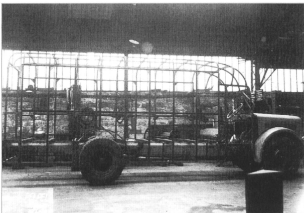
Kastenaufbau von Pelpel auf 3CT1D

Saurer Arbon gründet 1910 an der Rue de Verdun in Suresnes ihre französische Auslandsfiliale durch die Übernahme der Fabrik von Darracq-Serpollet, die früher dampfgetriebene Nutzfahrzeuge herstellte. 1917 wird die Rechtsform geändert: von nun an ist Saurer France eine Aktiengesellschaft.