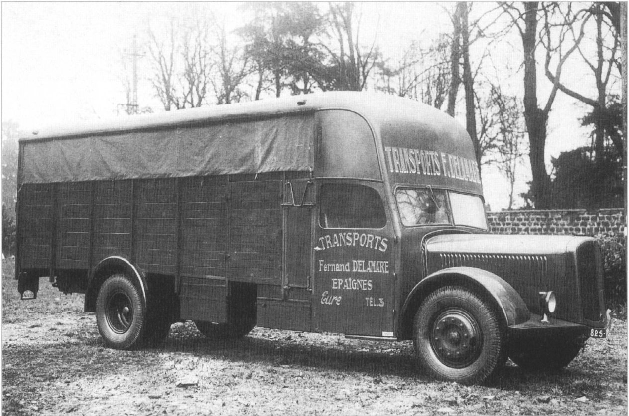
Viehtransportaufbau mit seitlicher Belüftung von Surirey auf 3CT1D. Die Öffnung hinter dem Fahrerhaus ist für das Reserve- rad bestimmt

Saurer Arbon gründet 1910 an der Rue de Verdun in Suresnes ihre französische Auslandsfiliale durch die Übernahme der Fabrik von Darracq-Serpollet, die früher dampfgetriebene Nutzfahrzeuge herstellte. 1917 wird die Rechtsform geändert: von nun an ist Saurer France eine Aktiengesellschaft.