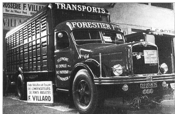
Viehtransportaufbau von Villard auf 8BUD