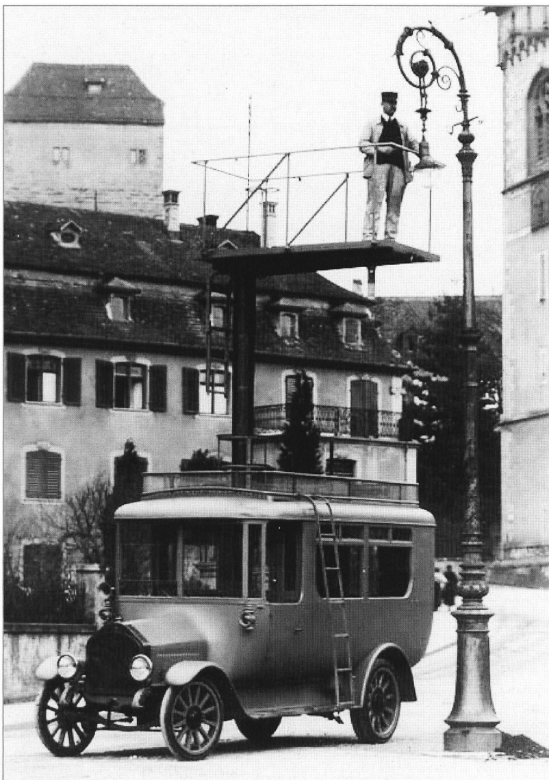
Ein Bild voll Harmonie: Lampenwechsel mit Saurer-Turmfahrzeug. Das zierliche Fahrzeug, die wunderschöne Jugendstil-Lampe... das war die gute alte Zeit!