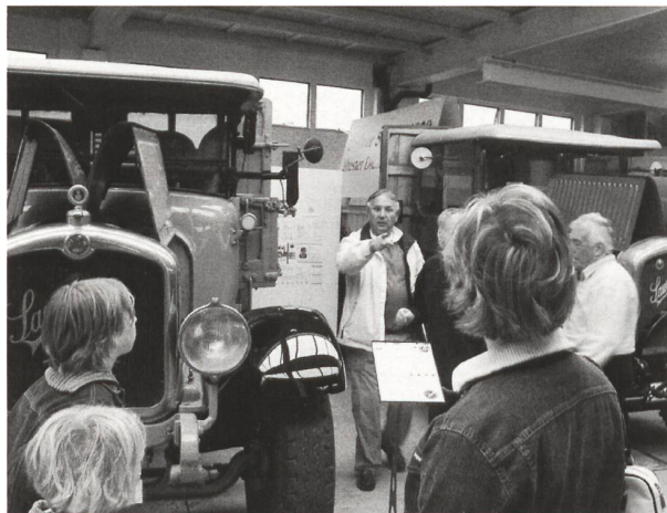
Er hat eine Geschichte zu erzählen!