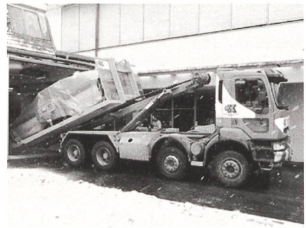
Ankunft der SAURER 500