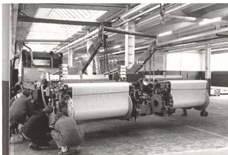
SAURER 500 am Kugler Kran