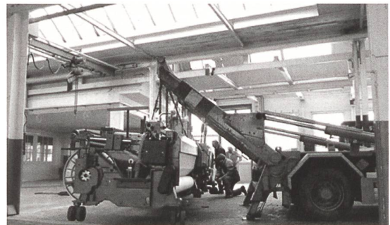
SAURER 500 bekommt Räder