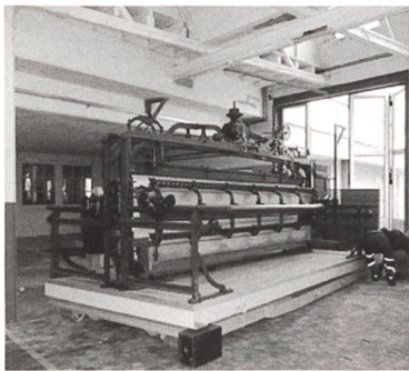
Ankunft der Handstickmaschine