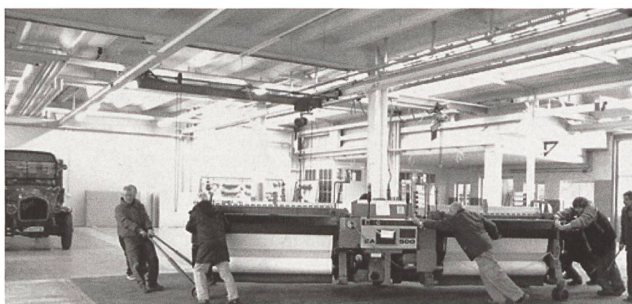
SAURER 500 rollt zum Bestimmungsort