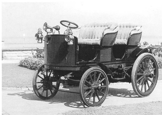
Saurer Doppelphaeton 1898