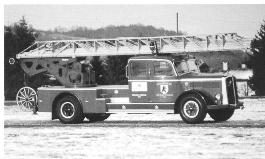
Feuerwehrdrehleiter Saurer N4C