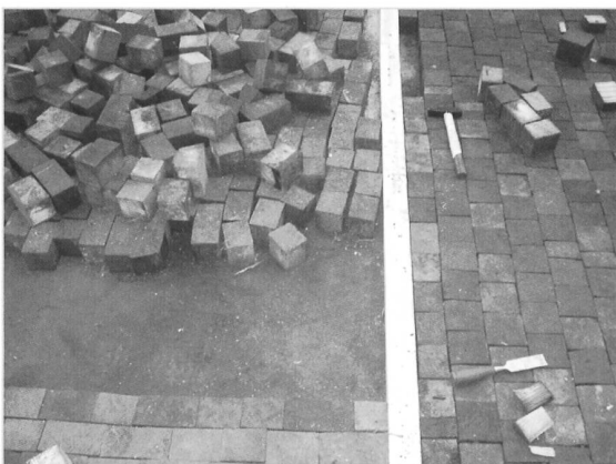
Links: Baustelle/rechts: neu verlegter und perfekt verteilter Klötzliboden, ein Werk unserer Rotary-Freunde und -Helfer

Klötzliboden waren auch zu flicken, sei es, weil die Klötzli irgendwann einfach herausgerissen wurden, sei es, weil Feuchtigkeit die Klötzli zum Schwellen