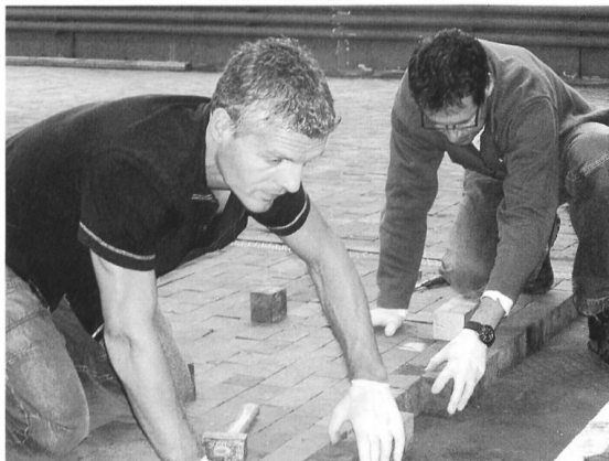
Zwei Rotarier bauen den Klötzli-boden neu. Die Handschuhe sind nötig, weil die Klötzli teilweise arg verölt und schmutzig sind, nicht weil die Rotarier zu „nobel“ sind für's Arbeiten!