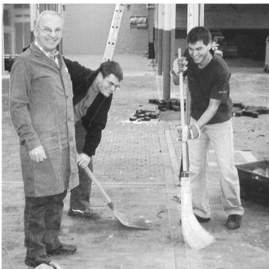
Drei OCS-Helfer an der Arbeit (was gibt's denn da zu lachen)