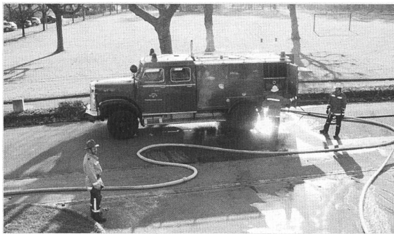
Löschen - heute