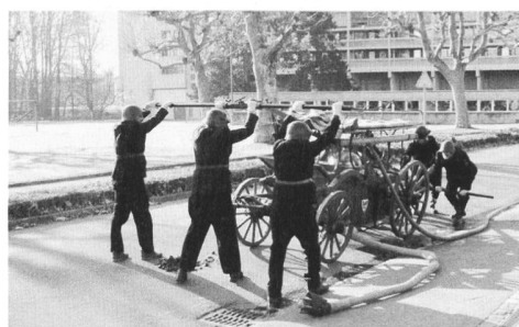
Löschen - früher