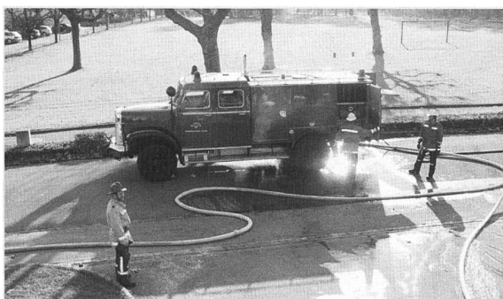
Löschen - heute