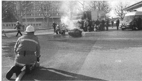
Löschen - in Zukunft