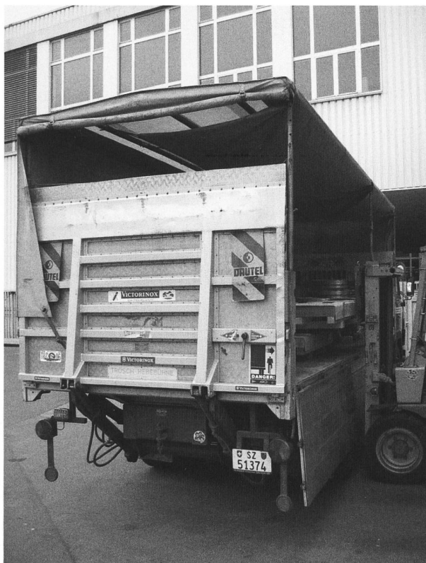
Die originale Trösch-Hebebühne hat 26 Jahre durchgestanden

Meistens war der Saurer mit Flachstahl für die eigenen Stanzmaschinen beladen. Dank regelmässig ausgeführten Servicearbeiten und mit viel Herz und Liebe des Chauffeurs ist der betagte Saurer auch heute noch gut im Schuss und voll einsatzfähig. Es war die Philosophie des Chauffeurs, auftretende Mängel sofort zu melden und die Konsequenz des Unternehmens, die Mängel innert nützlicher Frist beheben zu lassen, damit keine kostspieligen Reparaturen anfallen. Mitunter ein Grund, weshalb das Fahrzeug auch heute noch technisch wie optisch einen tadellosen Eindruck im Originalzustand erweckt. Einziger Schönheitsfehler dürfte der Dieseltank aus Kunststoff sein; diesen werden wir wieder durch einen originalen Treibstofftank aus Stahlblech austauschen.