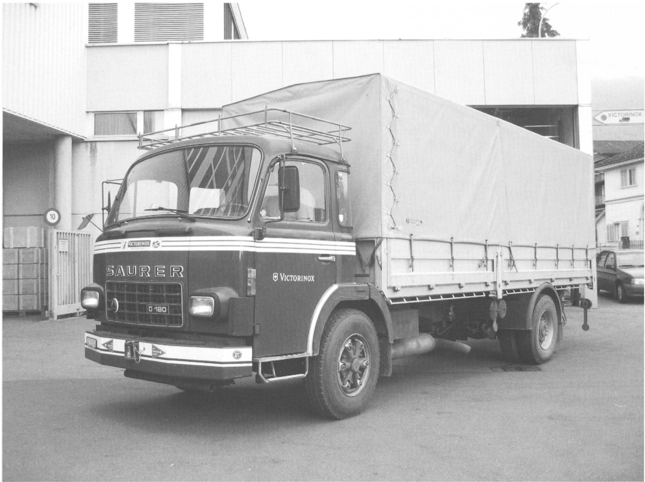
Der Saurer D180 - seit Dezember 2006 in Pension

26 Jahre lang stand der Saurer vom Typ D180 in der Zentralschweiz im Einsatz. Vergangenen Dezember durften wir vom Oldtimer Club Saurer das Fahrzeug zurück an seine Geburtsstätte nach Arbon holen. Es war der Wunsch des Chauffeurs sowie der Firma Victorinox, dass der sehr gepflegte Zeitzeuge der Nachwelt erhalten bleibt. Beim Typ D180 handelt es sich um die leichteste Ausführung, nebst den OM-Modellen, welche Saurer noch gegen Ende der LKW-Produktion in den 80er Jahren im Angebot hatte. Er stammte aus dem Produktprogramm „Sortiment '77“ und war für ein Gesamtgewicht von 15,5 Tonnen zugelassen.