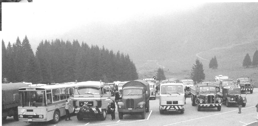
Auf der Schwägalp; es hätt „ineghängt“