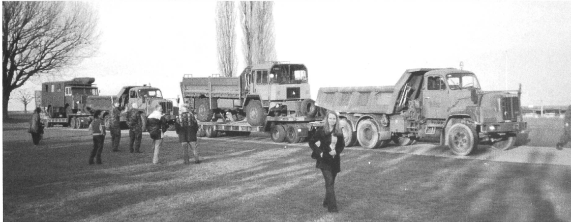
Zaungäste bei der Ankunft in Arbon