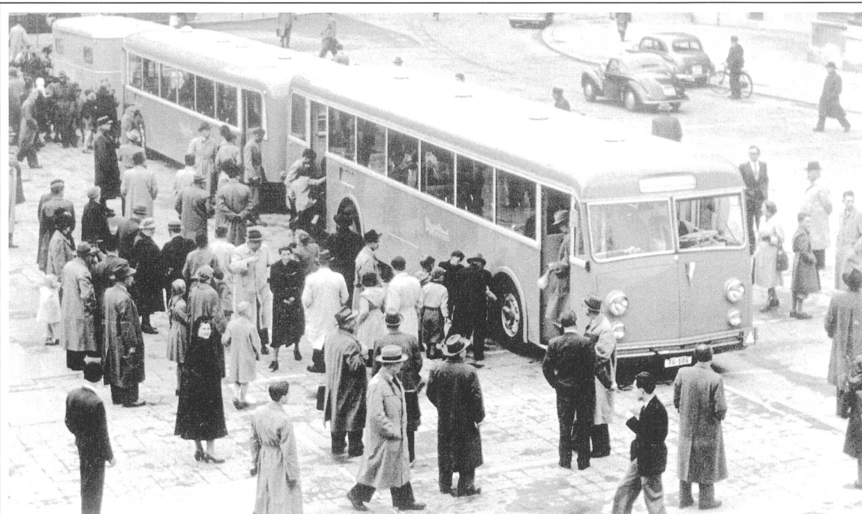
1952: Für Aufsehen vor dem Bundeshaus in Bern sorgte der über 30m lange 3-Wagen-Zug der ZVB

gewährleistete. Für die Karosserie wählten die Konstrukteure ein beplanktes Aluminium-Gerippe. Der nur 9,8 Tonnen schwere Wagen hatte ein Fassungsvermögen von 82 Personen (ohne Anhänger) und konnte die Steigung von 5,5 Prozent noch mit beachtlichen 44 Stundenkilometern befahren. Zusammen mit dem 11,7 Meter langen Personenanhänger und dem 6,1 Meter langen Gepäckanhänger verkehrten damals die Saurer 6H als gut 30 Meter lange 3-Wagen-Züge auf den Tal- und Bergstrecken der ZVB. Das vielbeachtete «Bähnli auf Gummirädern», war jedoch nicht bei allen Passagieren gleich geliebt, denn „im neuen Transportmittel konnte auf der Fahrt nach Zug nicht mehr so gejasst werden wie in der Strassenbahn!“ Als Ergänzung zu den acht Saurer 6H beschaffte die Zugerland Verkehrsbetriebe in den Jahren 1959 bis 1965 acht Saurer 5 DUK mit einem 220-PS 6-Zylinder-Motor, welche dann vorwiegend auf den Talstrecken zum Einsatz kamen. Für einen hohen Schaltkomfort sorgte das vollautomatische Divabus-Getriebe von Voith, welches bei Berna in Lizenz gebaut wurde. Gestartet wurde der Motor durch einen Heywood-Nova-Druckluftstarter, welcher mit 35 bis 40 bar Überdruck den Motor in Sekundenschnelle in Schwung brachte.