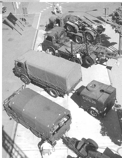
Dieselsepps Fahrzeuge M6 4x4, 4x4 Langholz, 2DM) von der Drehleiter aus fotografiert