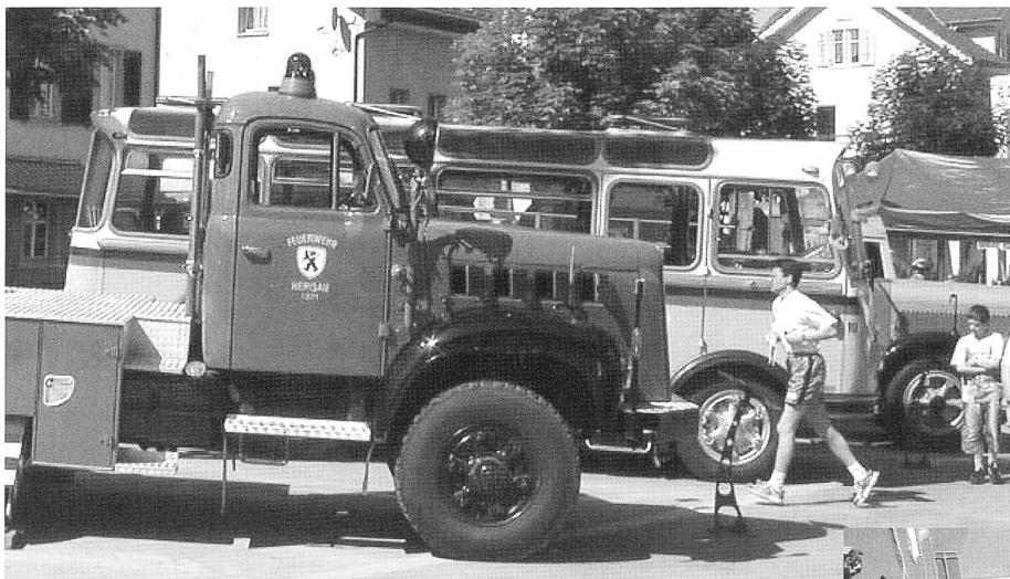
OCS-Fahrzeugparade mit Drehleiter Herisau, SV2C-Postauto, Schützengarten BLD, und ganz im Hintergrund Shell-Schlepper