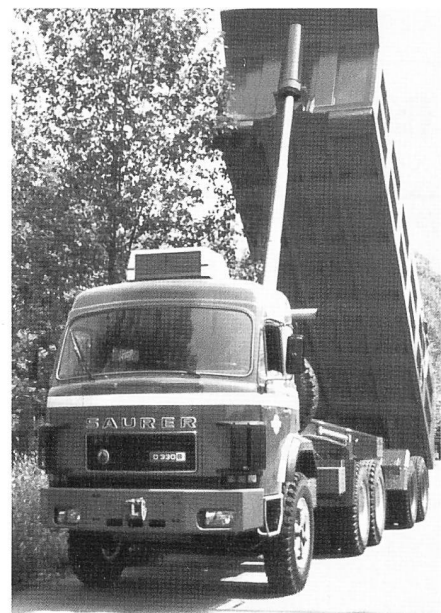
Saurer im Einsatz auf einer Baustelle im Irak