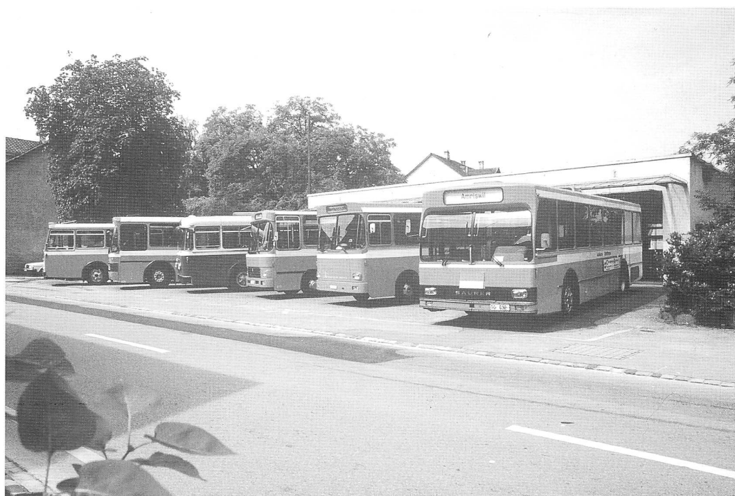
Die flotte Flotte der AOT. Wo ist „unser“ SH-Bus?