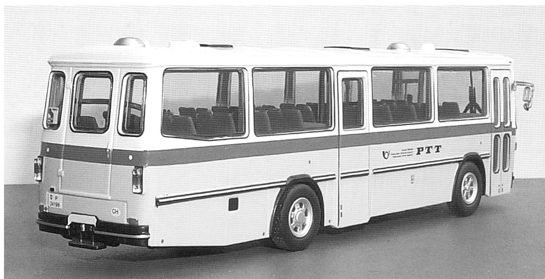
Bild 2: Das Modell von hinten; es fehlt nichts, die Speichenräder sind gut dargestellt.