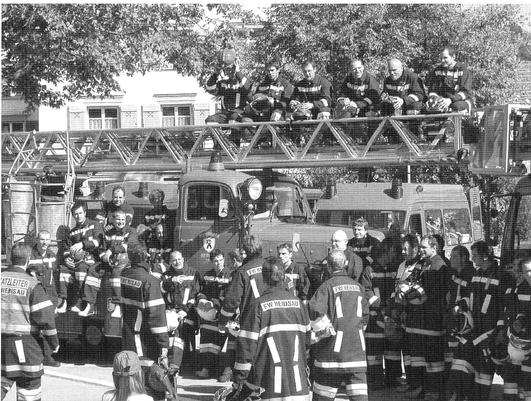
Feuerwehr bereitmachen zum Abschiedsföteli!