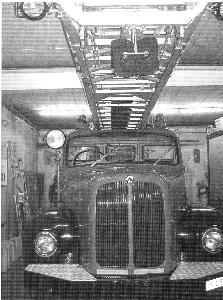
ADL Herisau noch im Aktivdienst“ (Depot Fw Herisau, 18.11.2003)