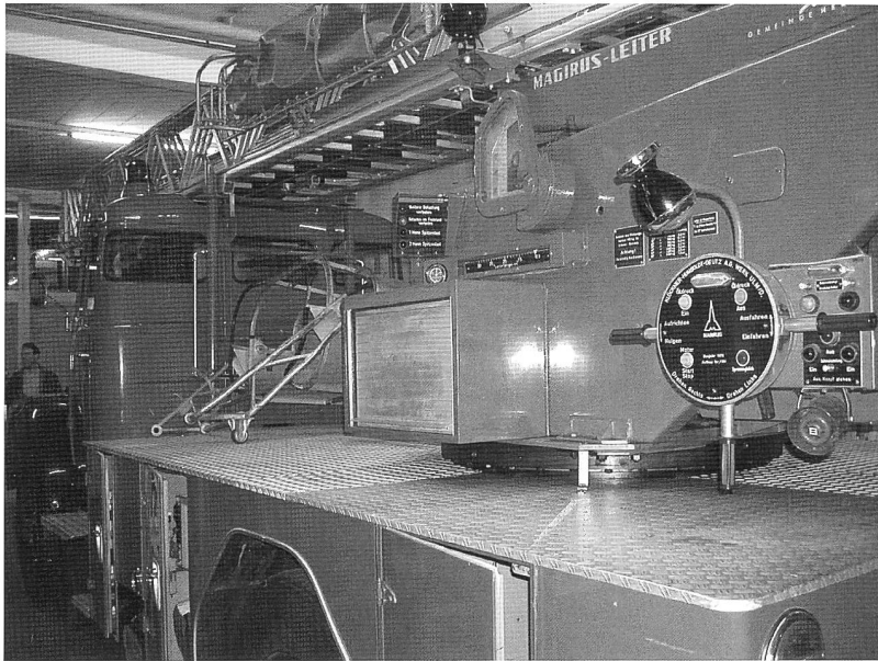
Detail der Magirus-Drehleiter. Das zentrale Bedienelement, die runde Scheibe mit den Hebeln für Heben und Senken, Drehen und Aus- Einziehen sieht eigentlich genau gleich aus wie bei der „Grossmueter“ Tigerberg 51 (Depot Fw Herisau, 18.11.2003)