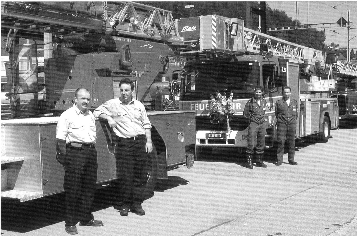
Die OCS-Übernahme-Equipe vor der „alten“ ADL Jahrgang 71 und hinten das brandneue Gefährt mit der Equipe der Fw Herisau. Ganz im Hintergrund unsere „Grossmueter“