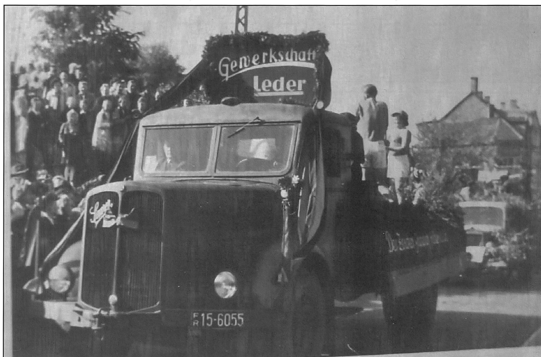
Foto aus den 50er Jahren: Saurer, vermutlich aus österreichischer Produktion. Kennzeichen: FR steht für Französisch Rheinland (Besatzungszone), die Zahl 15 für die Stadt Primasens (D).