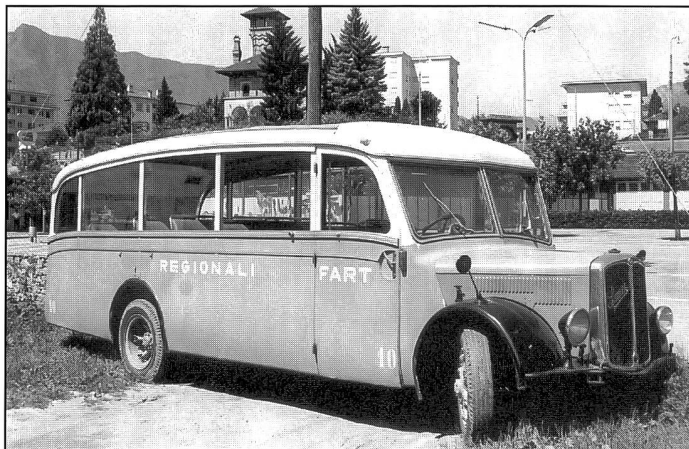
Saurer/Regazzoni 2C CR1D Alpenwagen (1946) der FART

Die 13 ganzseitigen Schwarzweissfotos machen den Busoldtimerkalender 2004 (Format 42 x 30 cm) zum idealen Geschenk für verkehrshistorisch Interessierte.