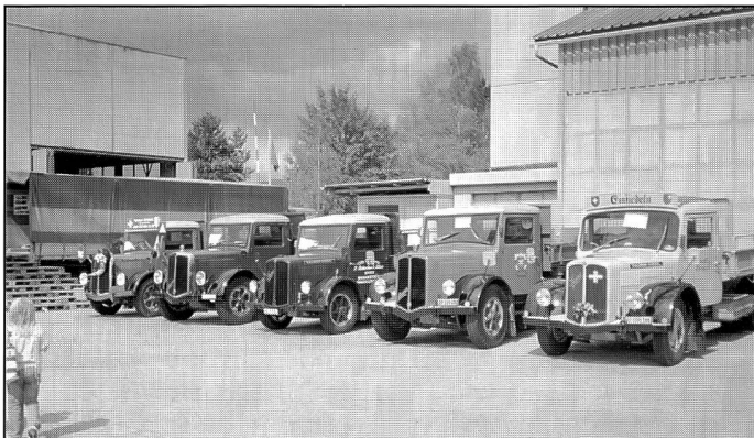
Saurer vom Typ 2C

„Stammgäste“, aber auch zahlreiche bisher noch nie ausgestellte Fahrzeuge waren zu bestaunen, darunter auch einige spektakuläre Umbauten. Obwohl es seit 20 Jahren keine neuen Saurer mehr gibt, findet man am Saurer-Treffen immer wieder welche, die aussehen als wären sie erst gestern ausgeliefert worden. Als einziger Wehrmutstropfen bleibt, dass bei schönem Wetter die Dreihunderter-Marke wohl doch noch überschritten worden wäre!