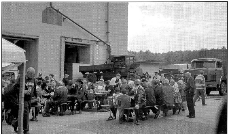
Saurer Caminhao im Mittelunkt

Die Besucher wurden aber am Nachmittag mit trockenem und zunehmend besserem Wetter belohnt, so dass sich der Anlass zum gewohnten Happening der schönen und interessanten Saurer/Berna-Fahrzeugen und deren Liebhaber entwickelte.