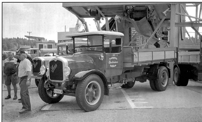
Wunderschöner A-Typ als Kipper

Textrecherche: Thomas Kugler