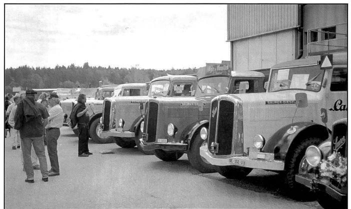
Saurer vom Typ 4C