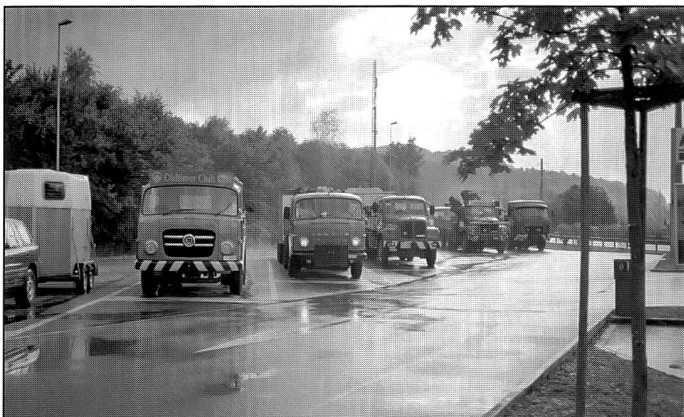
Kaffeehalt auf der Heimreise in Kölliken