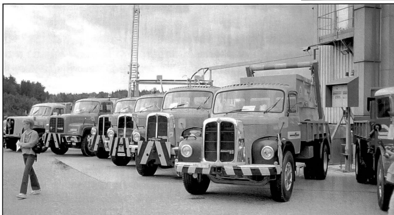
auf Hochglanz polierte Saurer; D-Typen um 1970