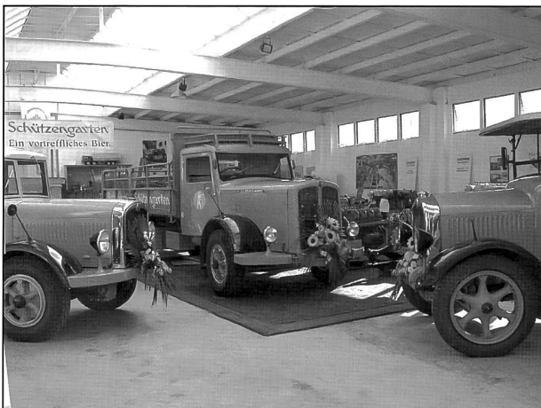
Die drei Saurer, der BLD links, der „jüngste“ C-Wagen in der Mitte und rechts die über 70jährige „Grossmutter“, der 2AD von 1929.

Ära, der älteste, ein Kettenwagen aus dem Jahr 1912, welcher für Schauzwecke, Corsos und Ausstellungen gebraucht wird, und ein D-Typ von 1982, der als Kipper umgebaut, weiterhin im Alltagseinsatz Malz transportiert.