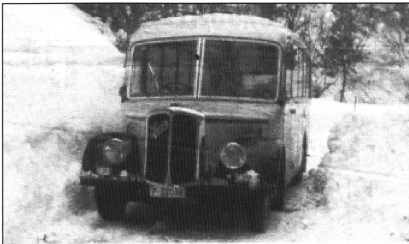
Heisse unbarmherzige Wüsten....

waren oftmals sehr schmal und steil. Bei solchen Einsätzen stellten sich die Postautos dieses Typs als wahre Alleskönner heraus. Auf der Strecke nach Corona beispielsweise, mussten die Fahrzeuge einen engen Torbogen passieren: eine Aufgabe, die für einen anderen Bus aus der Tessiner Flotte, unmöglich gewesen wäre.