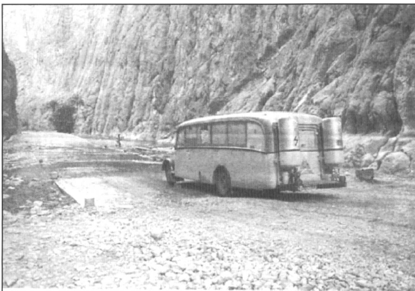
..... und unwegsame Gebirge galt es auf der Reise nach Nepal zu überwinden.

Er hat sein Ziel nie aus den Augen verloren. Auch wenn alles noch so aussichtslos erschien, behielt er stets die Geduld; denn, wie er es selber auf den Punkt brachte, will gut Ding seine Weile haben.